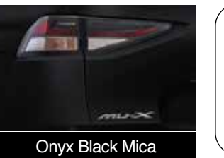
Onyx Black Mica